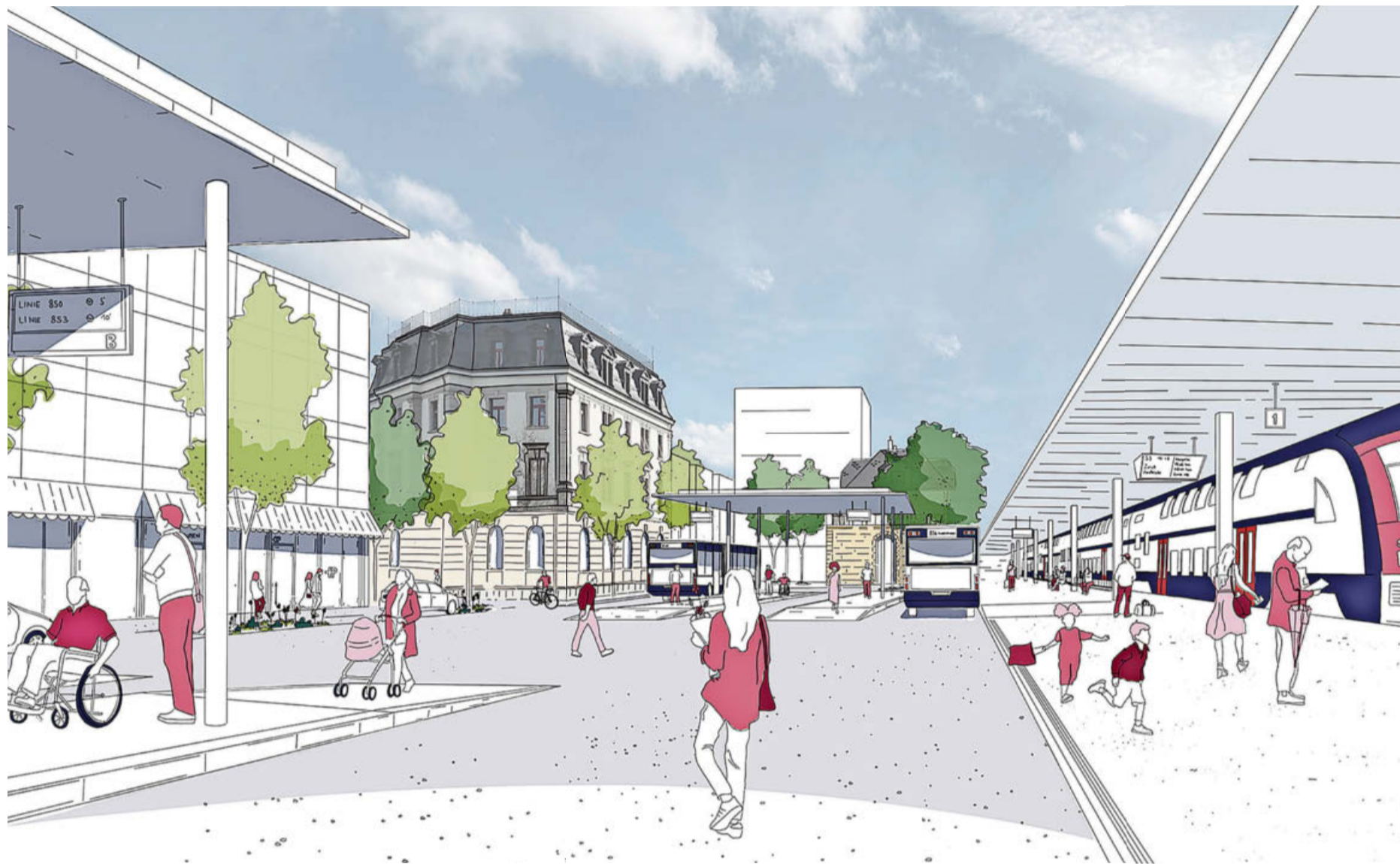
Bis im Jahr 2040 soll der Busbahnhof überdacht sein und mit behindertengerechten Fliesstufen ausgerüstet werden.

Der Rundgang führt auch zu den Park-and-ride-Flächen ge-