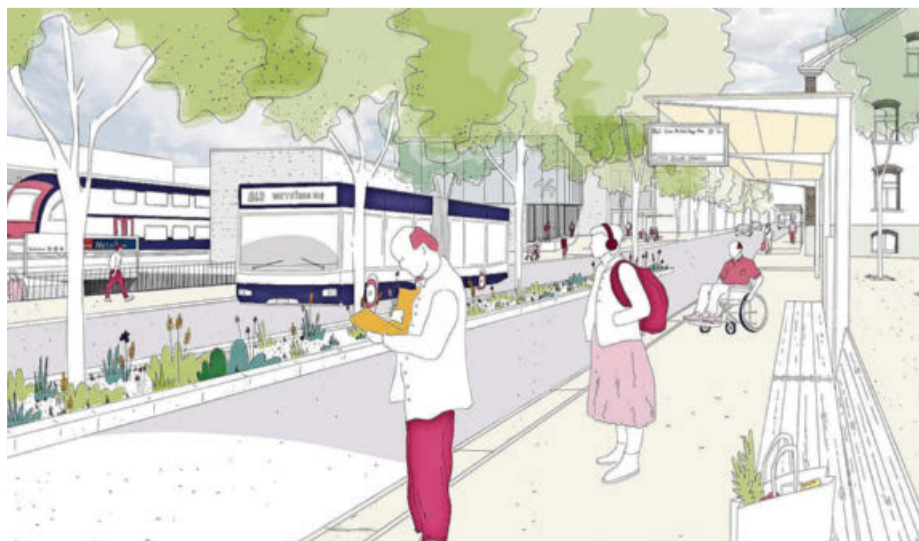
So soll der Busbahnhof an der Guyer-Zeller-Strasse aussehen.

Ob das Stimmvolk dem Plan am 14. Juni zustimmt, ist Zukunftsmusik – die Stimmung im Saal lässt an diesem Abend wenig Rückschlüsse darauf zu. Das Parlament hatte bereits im Januar dem Plan zugestimmt.