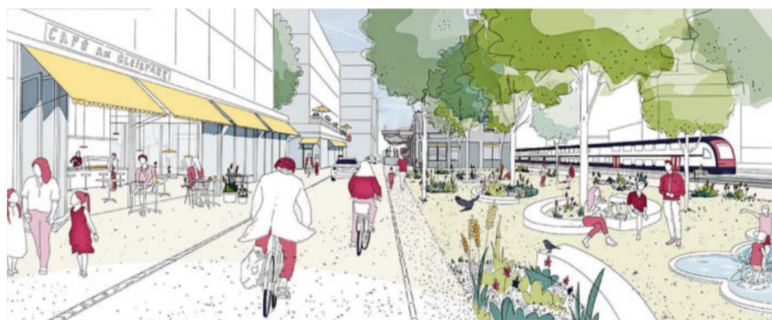
Wie der Bahnhof der Zukunft im Detail aussehen wird, ist noch nicht klar. Denn die Planungsarbeiten gehen weiter.

Der Stadtrat wies diesen Vorwurf zurück. Die letzte Informationskampagne habe die Stadt bereits im April beendet. Die Ja-Kampagne sei von einem überparteilichen Komitee sowie von Unternehmen und Privatpersonen finanziert worden.